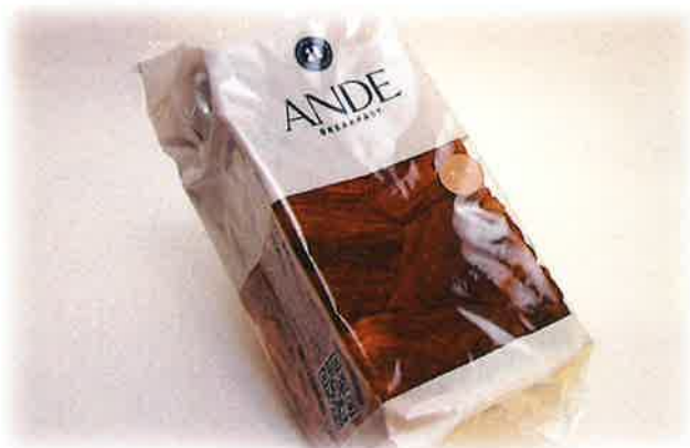
アンデデニッシュパン (1斤) ¥1,200