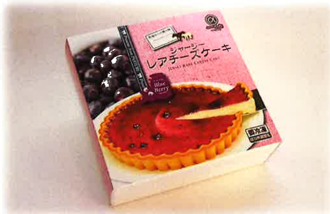
ブルーベリーレアチーズケーキ