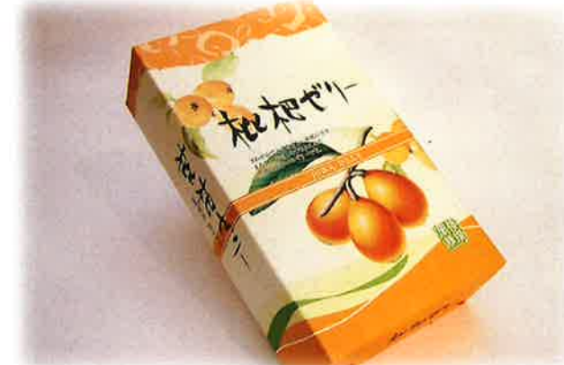
枇杷ゼリー (6個入り) ¥1,620