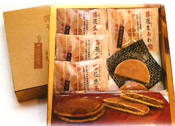
落花生あわせ (8枚入り) ¥1,080