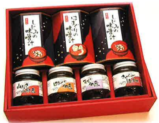
潮総 (うしおき) (味噌汁×3、佃煮×4) ¥3,240