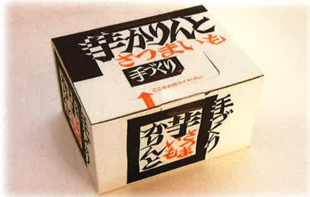
手作り芋かりんと (580g) ¥1,080