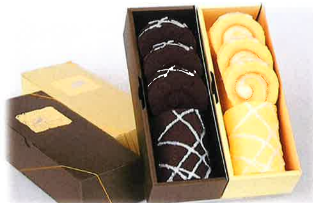
ロールケーキ (チョコクリーム/チーズクリーム) 各 ¥1,080