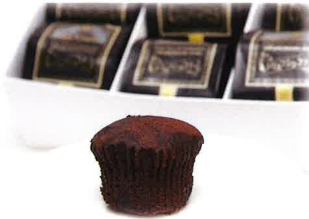
トリュフショコラ (9個入り) ¥2,700