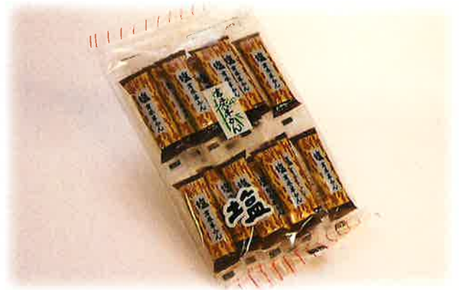
塩ようかん (14本入り) ¥470