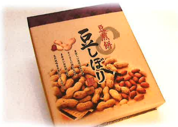
豆しぼり (20枚入り) ¥1,080