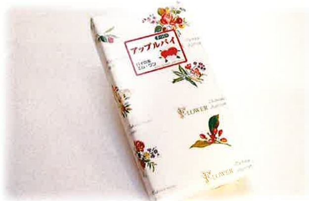
アップルパイ (ファミリーサイズ) ¥1,730